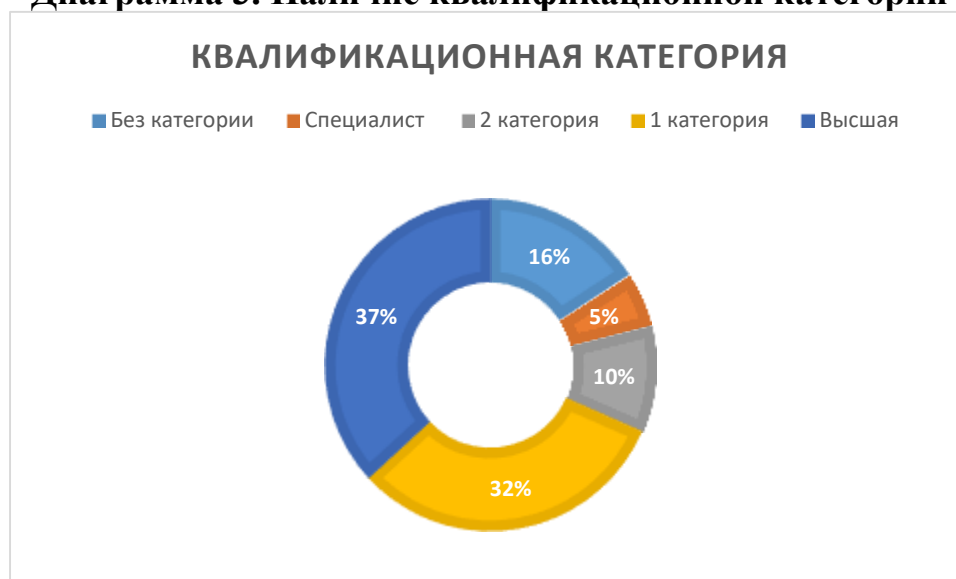
Диаграмма 3. Наличие квалификационной категории

Ежегодно педагоги подтверждают и повышают свою квалификационную категорию. Участвуют в творческих школьных и городских конкурсах, проводят открытые уроки, мероприятия, консультации, семинары для слушателей областных и городских курсов.